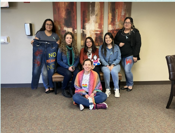
Casa Fortaleza staff, Denim Day 2023

DRAWING CONNECTIONS PREVENTION DEMANDS EQUITY