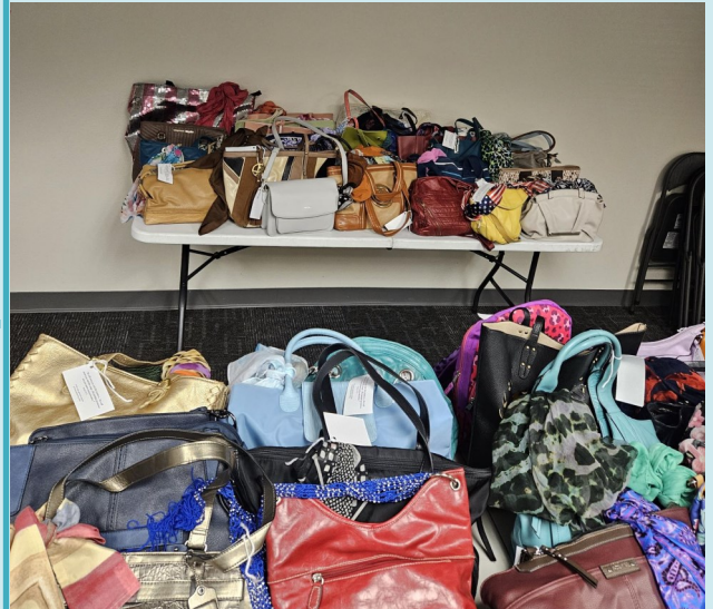
Pursunalities Plus, Purse donations. Pursunalities Plus, Donaciones de bolsas de mano.