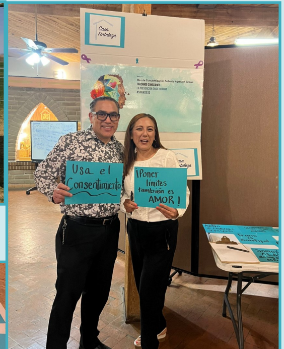
Presentacion en la Iglesia San Martin de Porres