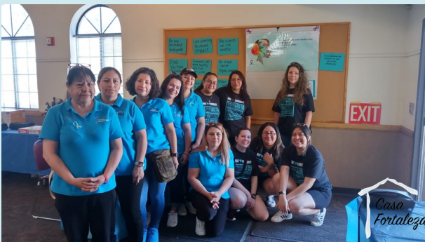
Casa Fortaleza staff and promotoras were working to raise awareness about sexual assault. Trabajando juntas para crear conciencia sobre la violencia sexu-

April 2023 was sexual assault awareness month. This month we wanted to raise public awareness about sexual assault and educate communities and individuals on how to prevent sexual violence. Sexual assault can take many different forms, but one thing remains the same: it's never the survivors fault.